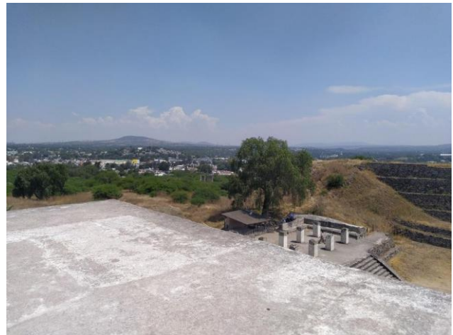
Figura 1. Ciudad de Tula vista desde el Parque Nacional de Tula.

práctica, el parque opera como un espacio aislado en términos de gestión, mientras que la ciudad continúa avanzando bajo lógicas de mercado, usos irregulares y procesos de autourbanización. El resultado son incompatibilidades territoriales persistentes, donde la expansión urbana amenaza con deteriorar tanto el ecosistema como el patrimonio arqueológico, al tiempo que reproduce desigualdades y fragmentación urbana.